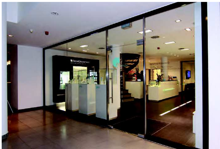
Abb. 1: Räumlich abgetrennte dermatocosmetische Abteilung innerhalb einer Praxis.

Eine dermatocosmetische Abteilung kann nur dann erfolgreich arbeiten, wenn sie sich durch ihr äußeres Erscheinungsbild, ihre Angebote und ihre Zuordnung zur ästhetischen Medizin vom herkömmlichen Kosmetikstudio unterscheidet. Zwar werden immer häufiger in Kosmetikstudios ästhetisch-medizinische Behandlungen angeboten. Dies ist jedoch in den meisten Fällen nicht durch den Gesetzgeber gedeckt und wird auch gerade wieder beschnitten, beispielsweise bei der Mesotherapie. Sorgen Sie dafür, dass Ihre eigene Kosmetik nicht in Konkurrenz zu Studios in der Umgebung aufgebaut wird, denn eine sinnvolle Kooperation mit Kosmetikerinnen außerhalb der eigenen Praxis ist oft nützlich für beide Parteien. Es ist ratsam, das eigene Profil genau zu definieren und im eigenen Praxisangebot zu positionieren.