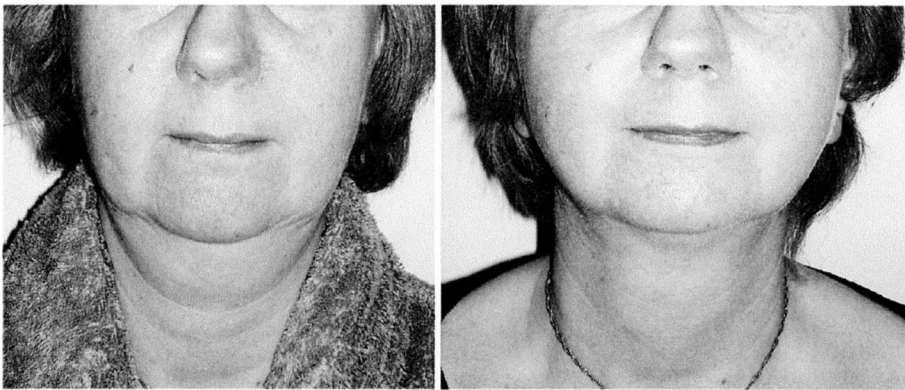
Abb. 2 Eine Behandlung an Wangen, Hängebäckchen, Doppelkinn und Hals. Feb. – April 2005.

vertrieben und ist derzeit in 53 Ländern als Medikament zugelassen. Die Hauptindikation seiner Anwendung liegt heute in der intravenösen Behandlung und Vorbeugung von Fettembolien beim polytraumatisierten Patienten, in der Behandlung von Fettstoffwechselstörungen und als Leberschutzpräparat.